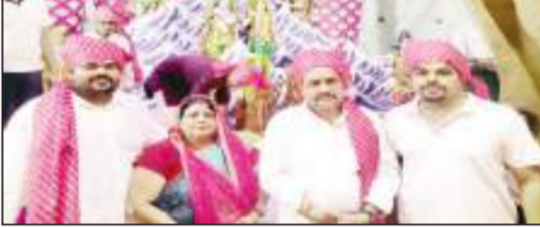
श्रद्धालुओं को भावविभोर कर दिया। बजरंगबली की जय और संकट मोचन हनुमान जैसे भजनों से मंदिर परिसर भक्तिमय माहौल में डूब गया। इस अवसर पर बड़ी संख्या में श्रद्धालुओं ने भाग लिया और भगवान