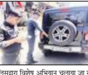
पुलिस को कार्रवाई ड्रंक एंड ड्राइव:जिले के सभी प्रमुख चौक-चौराहों व हाइवे पर एल्कोमीटर के साथ नाकाबंदी कर सख्त चेकिंग की जा रही है।