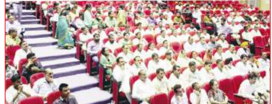
मुख्यमंत्री की वीसी में हिस्सा लेते निगम वार्ड कमिटीयों के सदस्य।