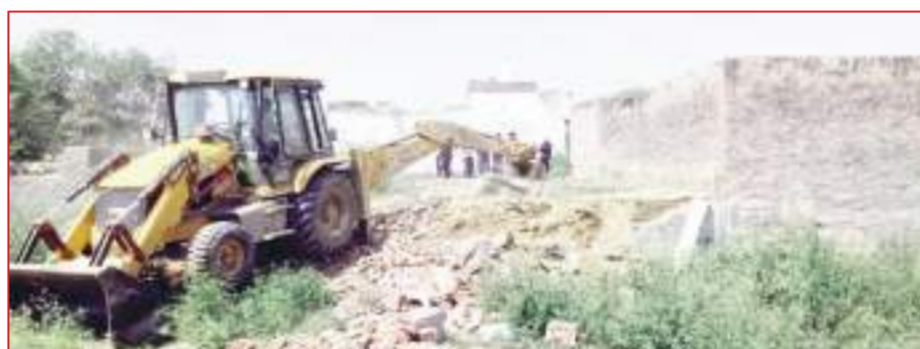
भूपानी गांव में अवैध रूप से बनाई जा रही कॉलोनियों में तोड़फोड़ करती जे.सी.बी मशीन।

फरीदाबाद, 16 अप्रैल, सत्यजय टाइम्स/सुनील अग्रवाल। फरीदाबाद में अवैध कॉलोनियों के खिलाफ डीटीपी एनफोर्समेंट विभाग का अभियान एक बार फिर तेज हो गया है। वीरवार को भूपानी क्षेत्र में बड़ी कार्रवाई करते हुए विभाग ने तीन अवैध कॉलोनियों को ध्वस्त कर दिया। जानकारी के अनुसार, ये कॉलोनियां करीब 9 एकड़ भूमि पर विकसित की जा रही थीं, जहां अवैध प्लॉटिंग के साथ निर्माण कार्य भी जारी था। डीटीपी एनफोर्समेंट की टीम ने जेसीबी मशीनों की मदद से मौके पर पहुंचकर सभी अवैध निर्माणों को तुरंत तोड़ दिया।